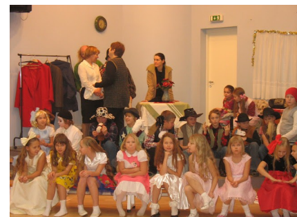
Küllil Luup jagab juhiseid